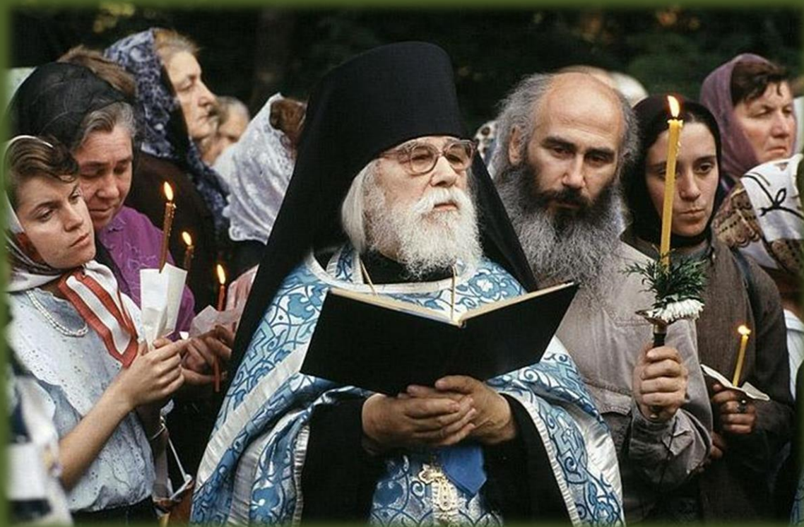
Архимандрит Иоанн (Крестьянкин)

служить. И постепенно приходит осознание многого, не только в понимании молитв, но и своих грехов. Это помогает как раз в борьбе с греховными помыслами, помогает как раз в борьбе со страстями.